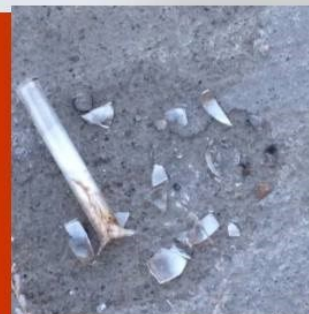
Tube de verre brisé