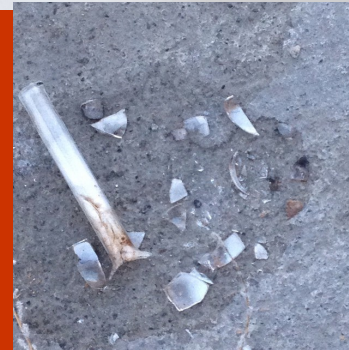
Broken glass pipes